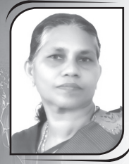
ശിൽഡ ജോൺ ചുള്ളിയാട്ട് ഒ.സ. ആന്റണീസ് യൂണിറ്റ്