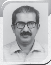
സിർജോ കുമിളുവേലിൽ C.A. സെൻ്റ് ചാവറ യൂണിറ്റ്

ഒ ന്നിലേറെ വിശ്വാസപ്രമാണങ്ങൾ ഉണ്ടോ? 'ഉണ്ട്' എന്നതാണ് ഉത്തരം. കുടുംബപ്രാർത്ഥനയുടെ ഭാഗമായി നാം വീടുകളിൽ ചൊല്ലുന്ന വിശ്വാസപ്രമാണവും കുർബാന മദ്ധ്യേ ചൊല്ലുന്ന വിശ്വാസപ്രമാണവും തമ്മിൽ ചില വ്യത്യാസങ്ങൾ ഉണ്ടല്ലോ. അതിനുള്ള കാരണം കണ്ടെത്തണമെങ്കിൽ എങ്ങനെയാണു വിശ്വാസപ്രമാണങ്ങൾ രൂപം കൊണ്ടത് എന്ന് മനസ്സിലാക്കണം.